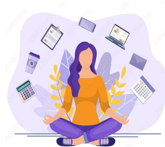
Redundanzen (analoges und digitales Arbeiten, Multisysteme, Multiprogramme)