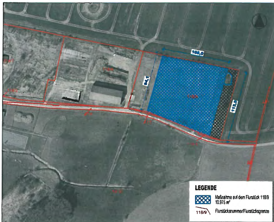
Maßnahmen auf dem Flurstück 118/9, der Flur 2 in der Gemarkung Gostorf