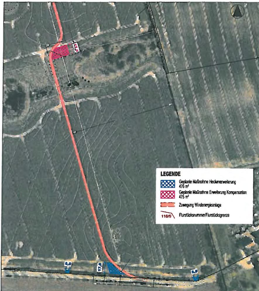
Maßnahmen auf dem Flurstück 1, der Flur 1 in der Gemarkung Kastahn