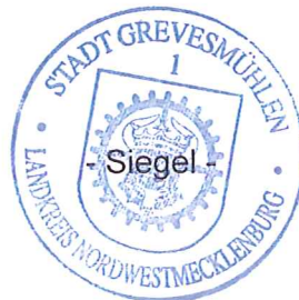
L. Prahler Bürgermeister Stadt Grevesmühlen